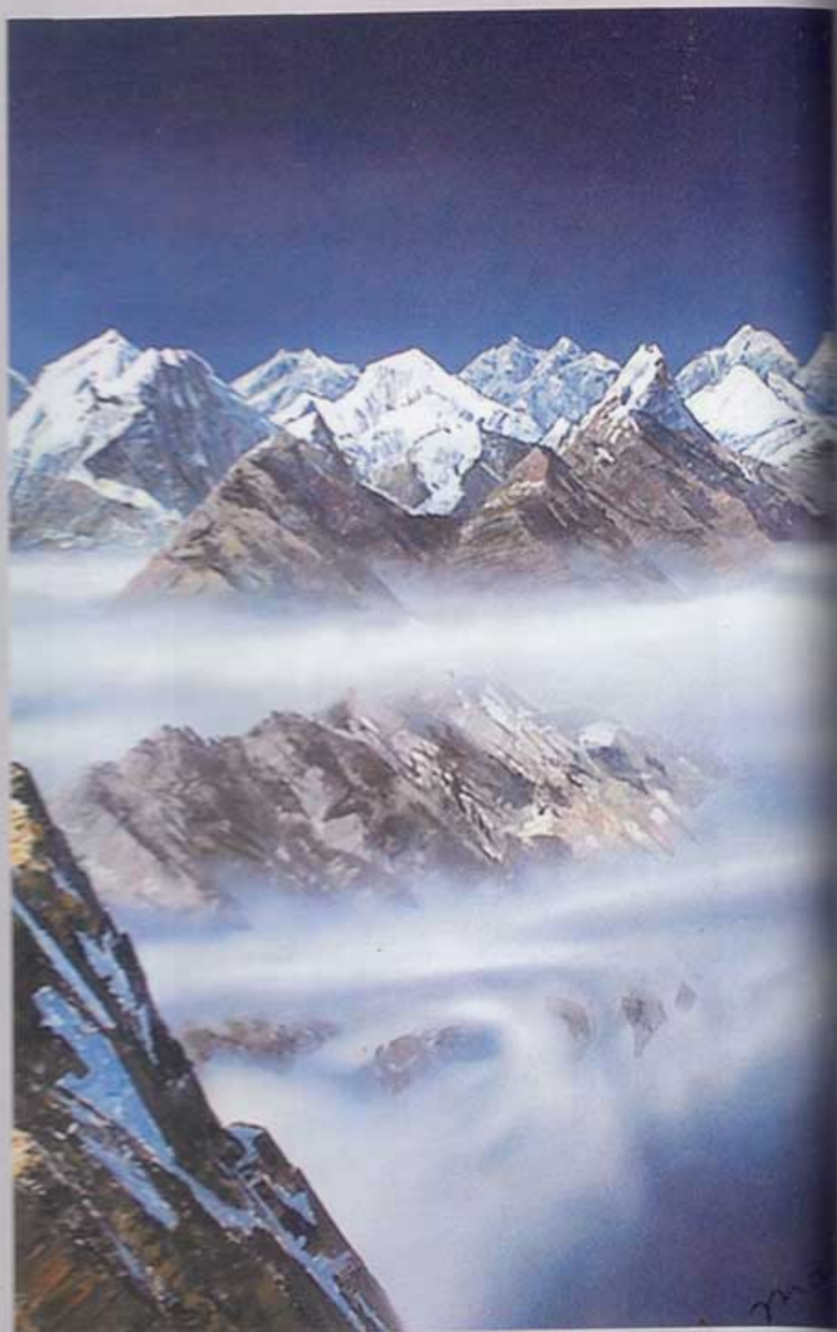
ОЗЕРА ПАМИРА. Картон, масло, 50x40см.