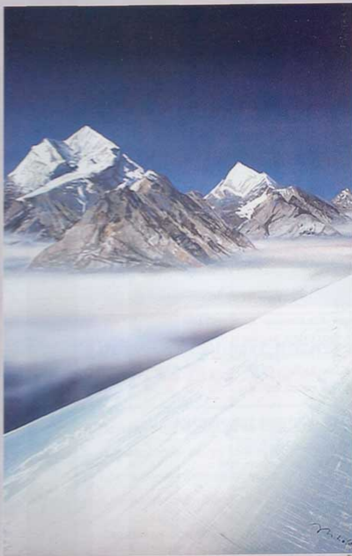
ДОМ ШИВЫ. Ширма, 4 части, картон, темпера, 240x90 см.