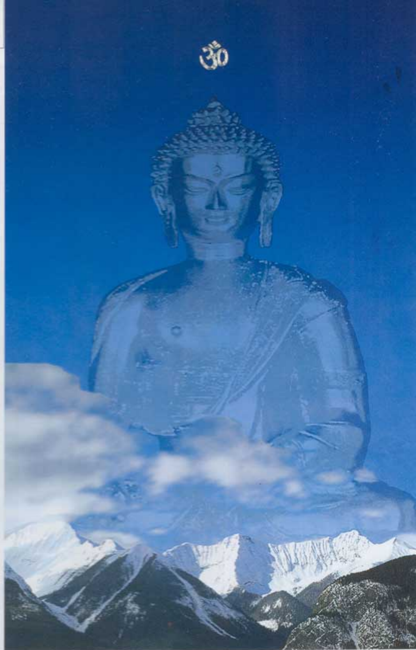
ТРАНСЦЕНДЕНТНОЕ ТЕЛО БУДДЫ