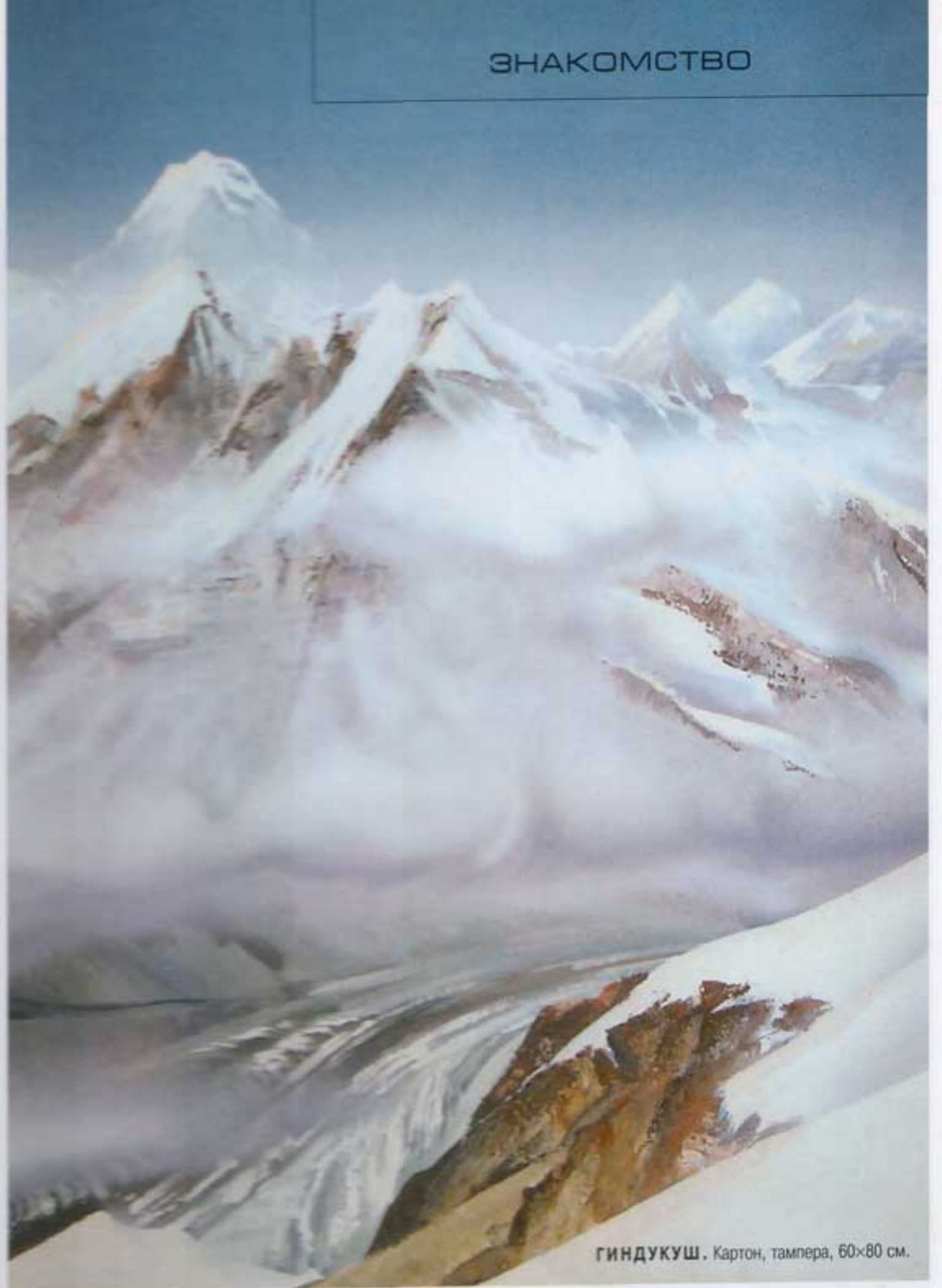
ГИНДУКУШ. Картон, тампера, 60x80 см.